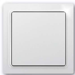
Taster mit Wippe